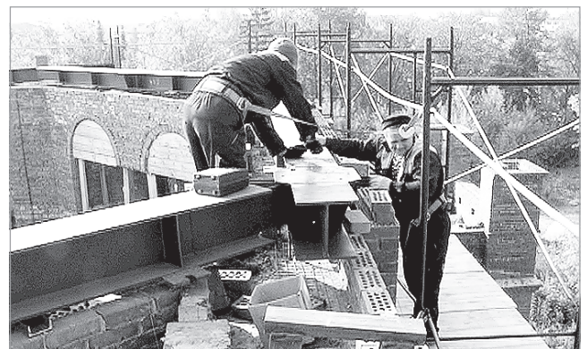
Закладка основания центрального купола храма