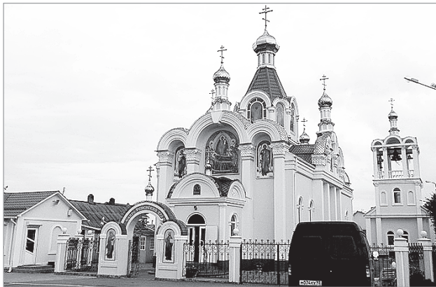
Так выглядит храм в городе Белореченске, где чуть более 50 тысяч жителей...

Для белореченцев их храм — это визитная карточка города. А чем можем гордиться мы, белоречане?