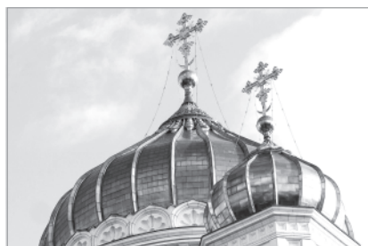
...и засияют купола!

БРАТЬЯ И СЕСТРЫ! В нашем городе строится Никольский храм. Строительство идет с трудом, но если позволит финансирование, то уже в этом году начнутся работы по строительству центрального свода храма. Это очень дорогостоящие работы! Ваши пожертвования сейчас крайне необходимы!