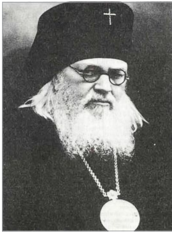
Святитель Лука Войно-Ясенецкий

«Христос Воскресе из мертвых, смертию смерть поправ и сущим во гробех живот даровав!»