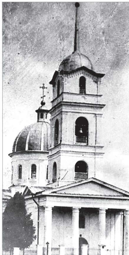
Казанская церковь, Верхне-Авзянский завод, начало 20 в.