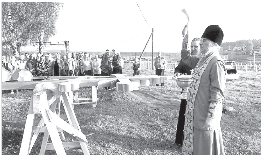
Владыка Никон во время молебна

Ч то же касается Туканской церкви, то предполагается, что ее освящение состоится в конце года. А пока впереди — отделочные работы.