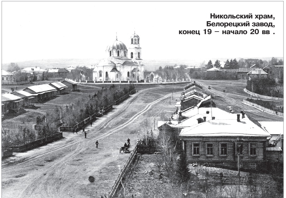
Никольский храм, Белорецкий завод, конец 19 – начало 20 вв.

неоднократно посещали высокие духовные лица. Челябинский краевед Л. Попов