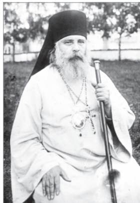
Архиепископ Григорий в Белоречке (август, 1927 год).