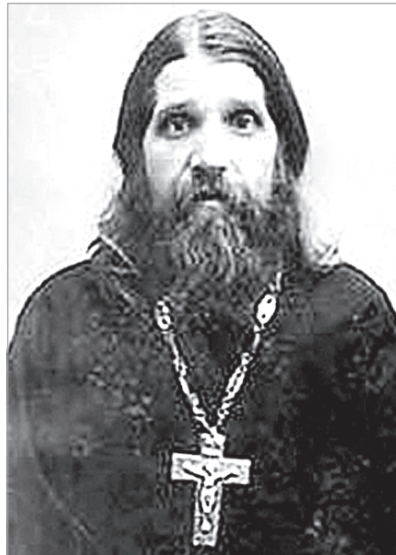
Преподобный Моисей Уфимский

Подвальное помещение, в котором жил этот удивительный человек, было погружено в полутьму, ибо маленькое окошко почти под самым потолком слабо пропускало дневной свет. Посредине комнаты стоял столб, поддерживающий перекрытия, дабы они не рух-