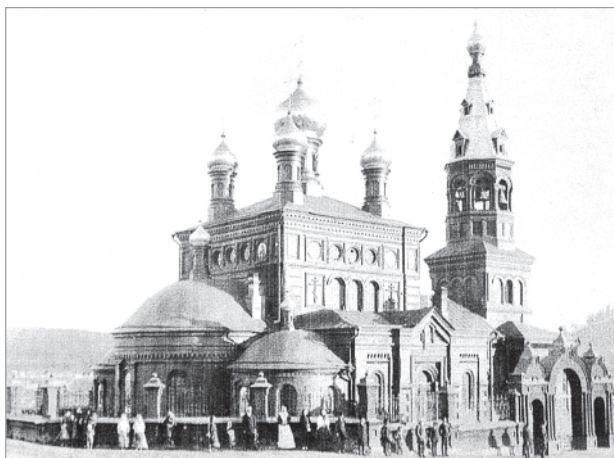
Так выглядел Никольский храм в селе Кага, конец 19 – начало 20 вв.