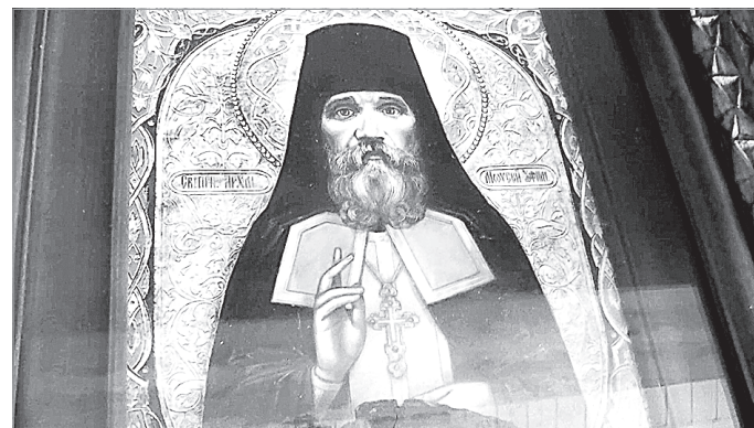
Чудотворная икона преподобного Моисея Уфимского