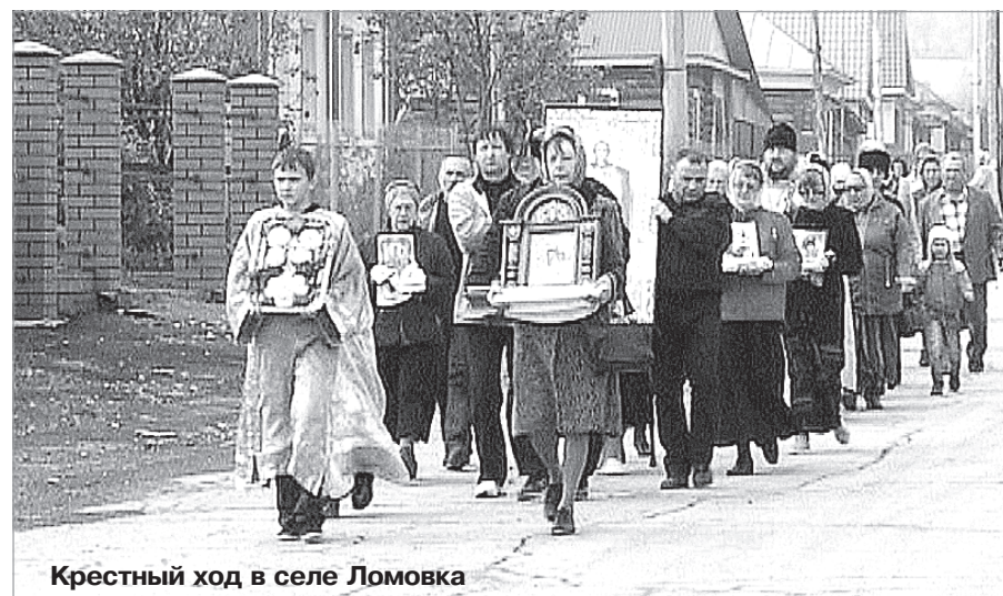
Крестный ход в селе Ломовка

П оклонный Крест в Ломовке — первая ласточка в духовном возрождении Ломовки, где вот уже несколько лет идет подготовка к строительству нового православного храма. Кстати, в годы Великой Отечественной войны (или чуть позже) в этом селе православные люди сумели построить церковь в самые кратчайшие сроки. Это случилось после пожара, в котором сгорел старый ломовский храм в честь Михаила Архангела... Неужели ломовцы в те трудные годы жили лучше, чем нынешние жители села? Почему мы сегодня не способны полноценно и во всей красе утвердить свою Православную Веру, чтобы над селом вновь звонко и торжественно разносился колокольный звон?