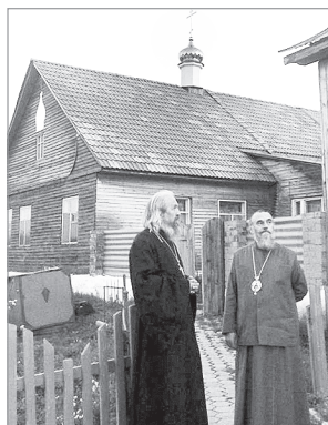
Владыка Никон посетил церковь в Миндяке