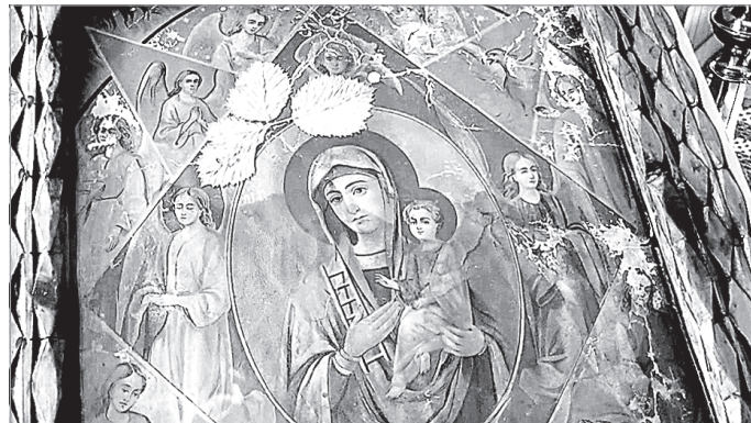
Чудотворная Икона Божией Матери Неопалимая Купина